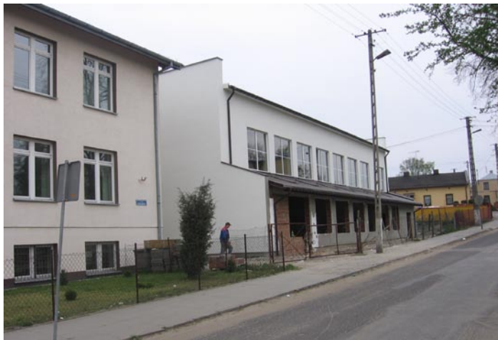
Budynek sali gimnastycznej w Osjakowie

B udowa sali gimnastycznej z zapleczem przy Publicznym Gimnazjum w Osjakowie to jedno z priorytetowych zadań inwestycyjnych gminy. Jak wiadomo, budowa została rozpoczęta w 2008 r. Obecnie prace są zintensyfikowane, realizowane zgodnie z założonym harmonogramem prac. Zakończenie prac przewiduje się w lipcu br., a przekazanie do użytkowania we wrześniu br. Obecnie inwestycja ta jest finansowana z dwóch źródeł, tj. środki własne gminy i środki Funduszu Rozwoju Kultury Fizycznej.