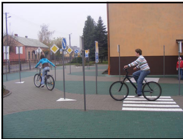
Miasteczko ruchu drogowego

2 kwietnia uczniowie klas szóstych pisali test sprawdzający. Ich wrażenia i opinie były bardzo różne. Większość jednak podzie-